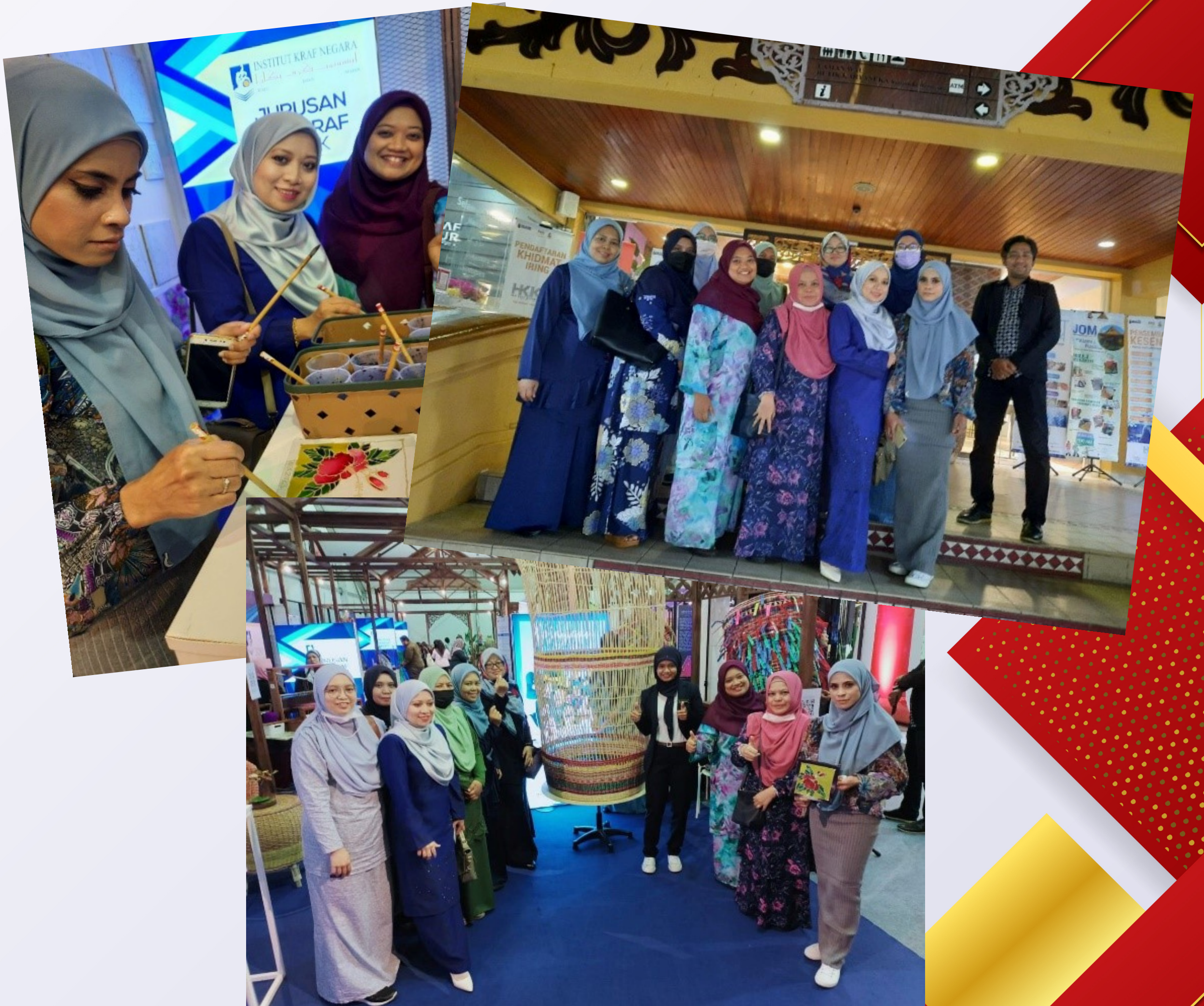
Lawatan Khidmat Iring Sempena Hari Kraf Kebangsaan 2023