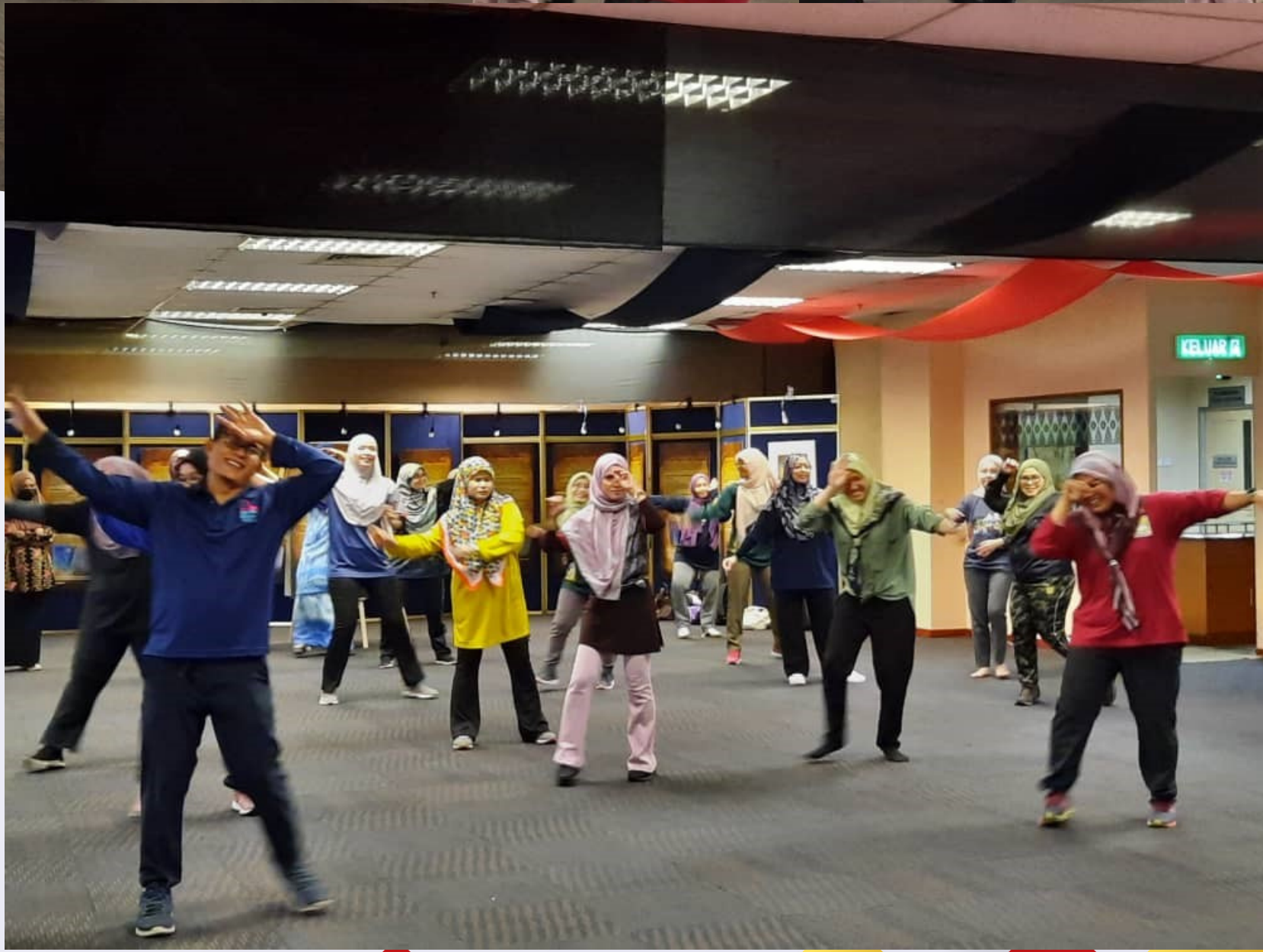
Senamrobik – “Aerobics So Fabulous”