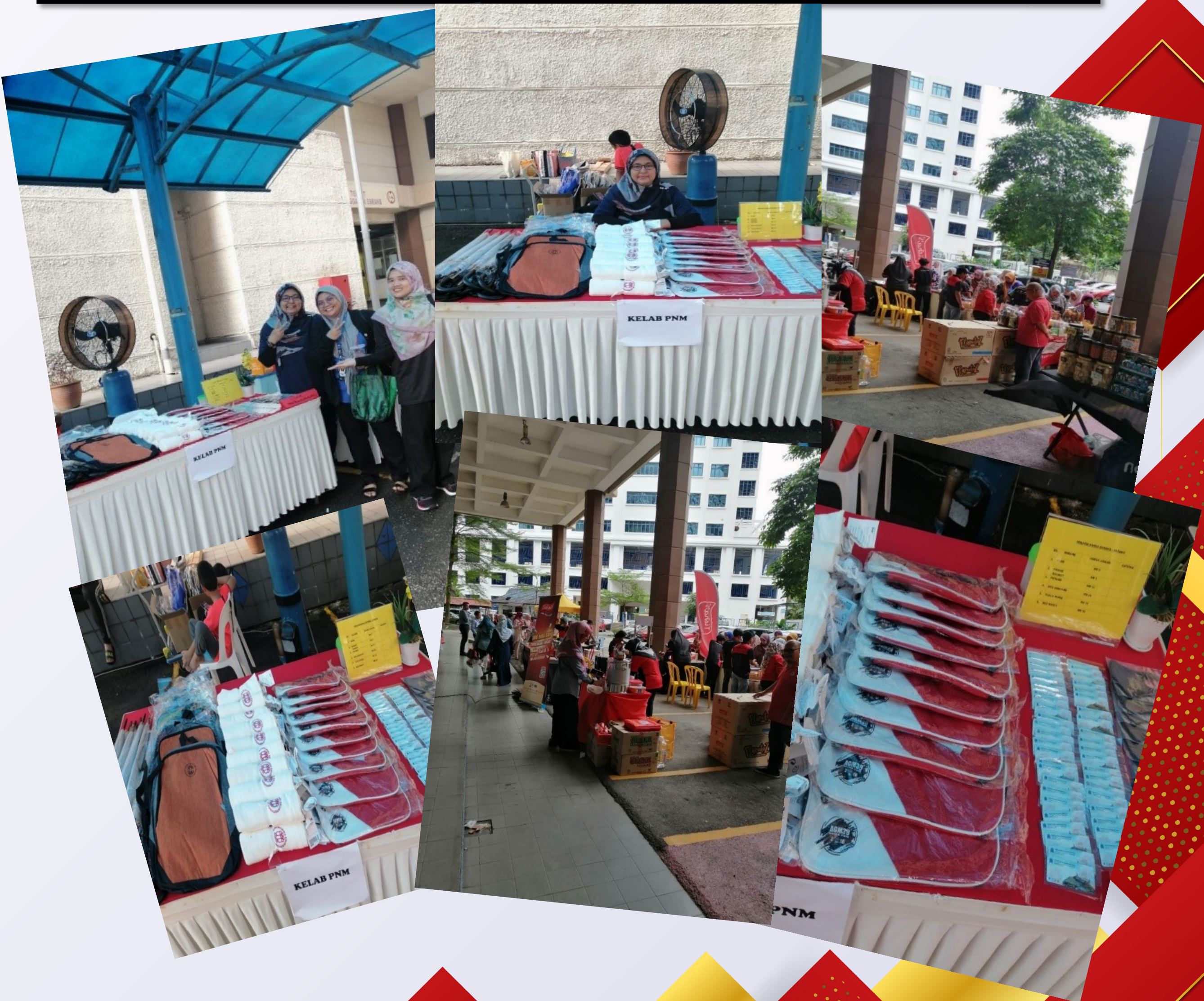
Sekitar gerai jualan Kelab PNM dan Pasar Rabu PNM