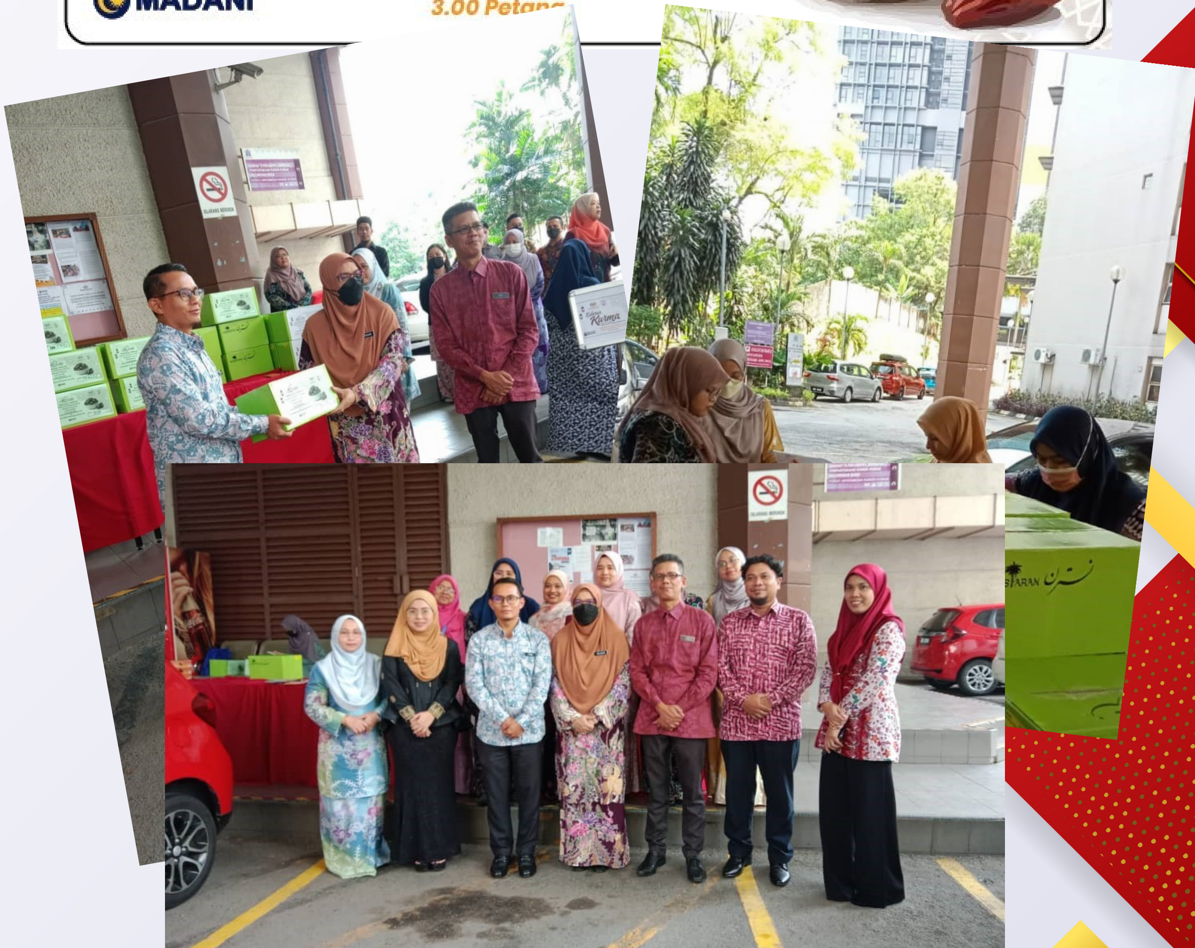
Sekitar Program Edaran Kurma PNM