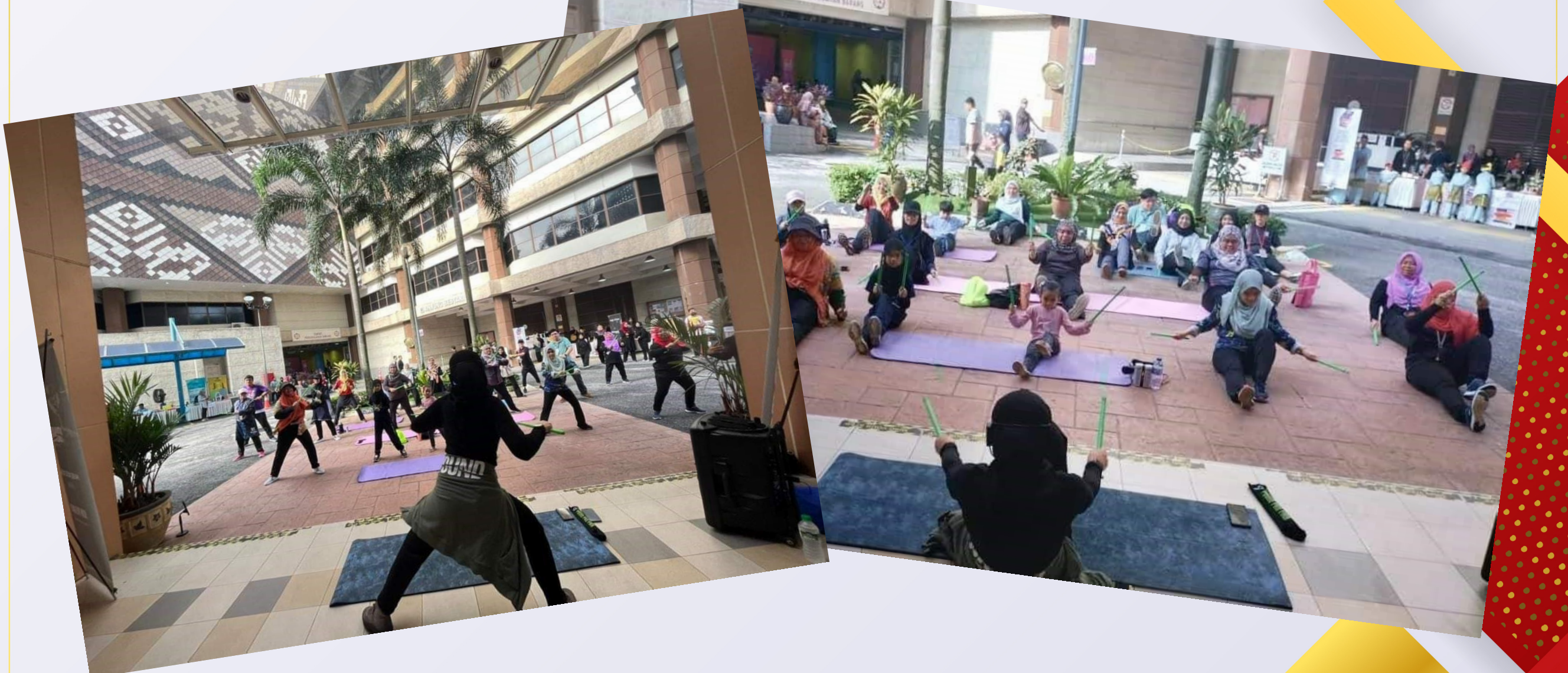
Pound Fit sempena Program Singgah Santai PNM