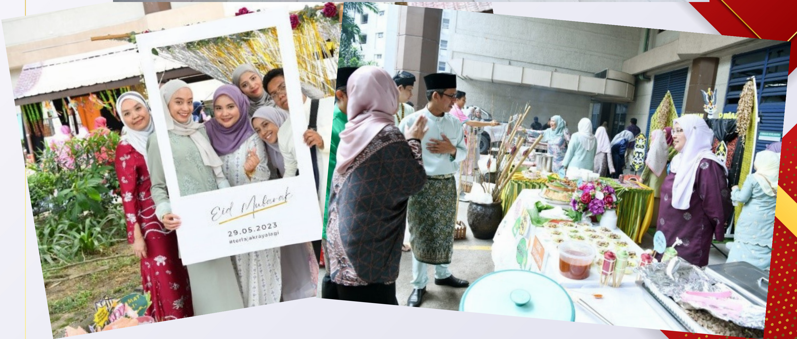
Jamuan Raya – “PNM Meriah Raya” 2023