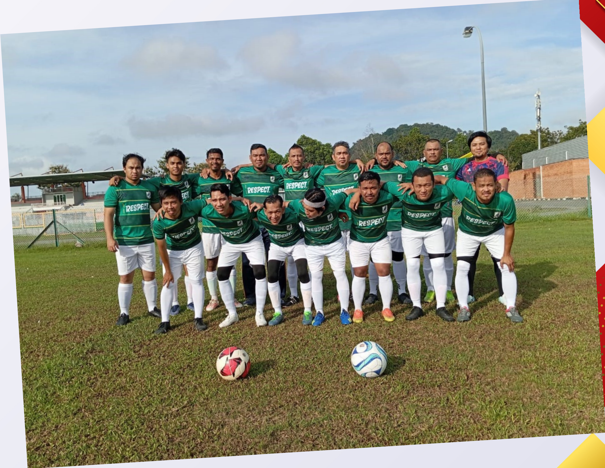
Kejohanan Sukan Integrasi Majlis Kebajikan dan Sukan Anggota-Anggota Kerajaan Wilayah Persekutuan (MAKSWIP) 2023