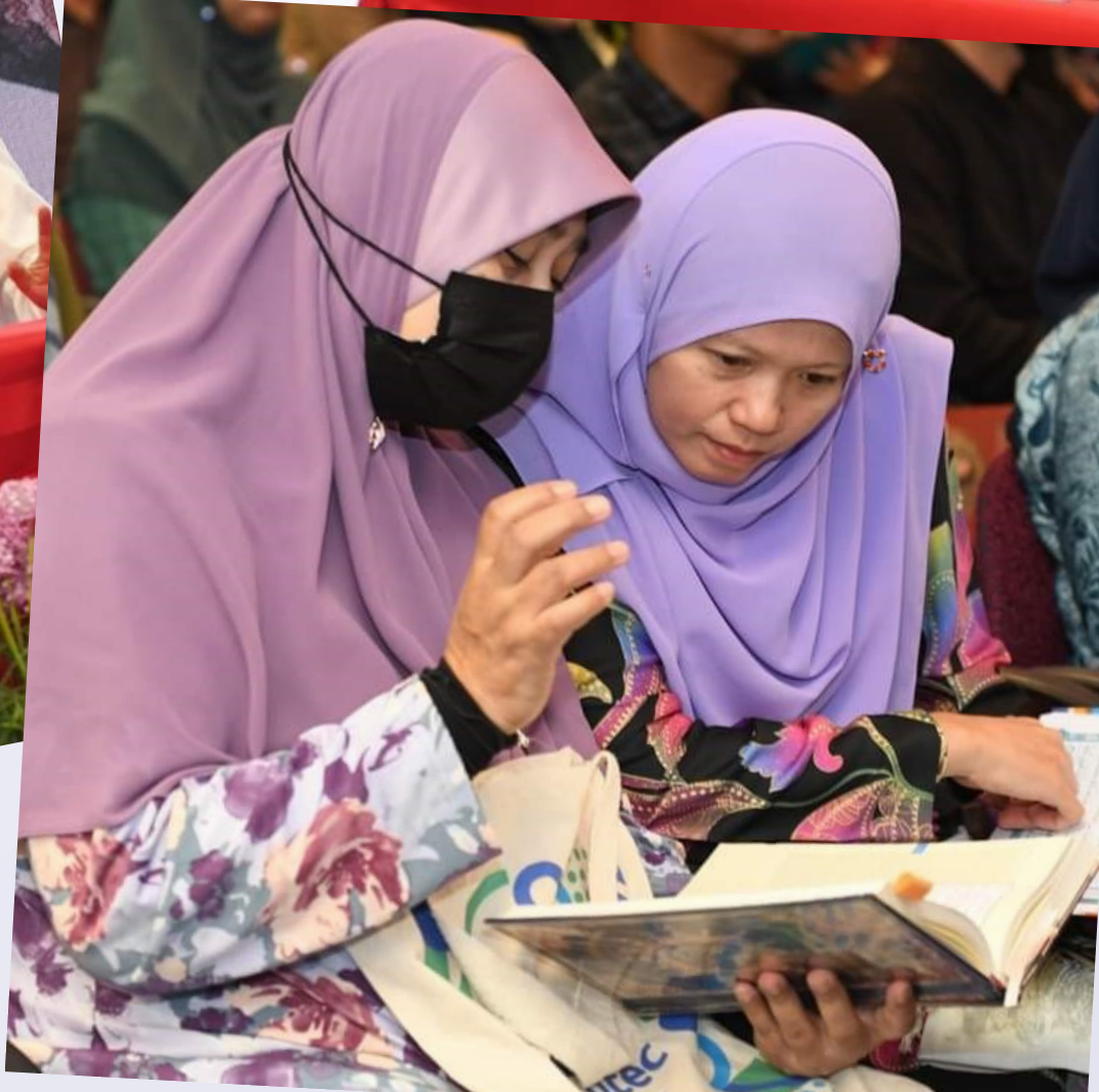
Sekitar Majlis Semarak Iqra' PNM